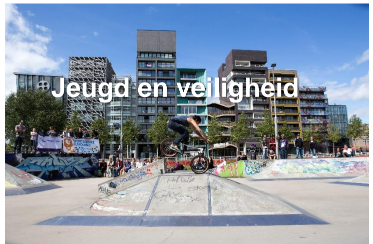
Jeugd en veiligheid